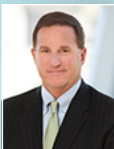
Mark Hurd 首席执行官