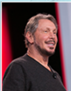
Lawrence J. Ellison 创始人、 董事会执行主席 兼首席技术官