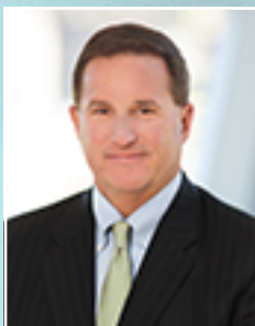
Mark Hurd Chief Executive Officer