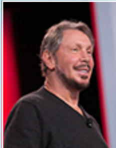
Lawrence J. Ellison Founder, Executive Chairman of the Board, and Chief Technology Officer