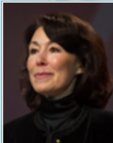
Safra Catz Chief Executive Officer