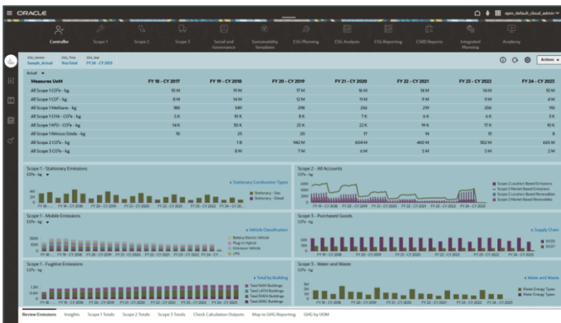
Tableau de bord ESG affichant les indicateurs sociaux