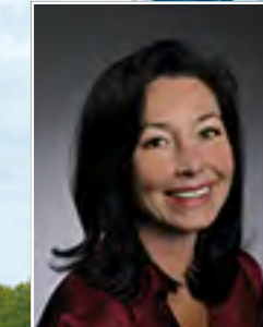
سافرا كاتز الرئيس التنفيذي