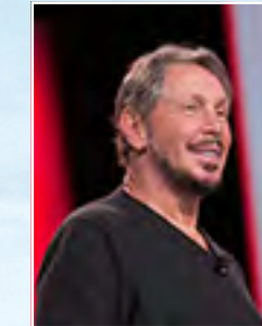
لورنس ج. إليسون فاوندر، الرئيس التنفيذي للمجلس، وكبير موظفي التكنولوجيا