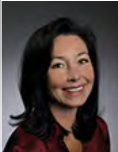
Safra Catz İcra Kurulu Başkanı