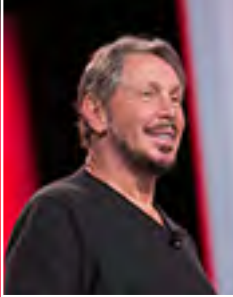
Lawrence J. Ellison Kurucu, Yönetim Kurulu Başkanı ve Baş Teknoloji Sorumlusu