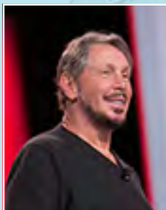
Lawrence J. Ellison 创始人、董事会执行主席、 首席技术官