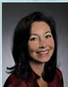
Safra Catz 首席执行官