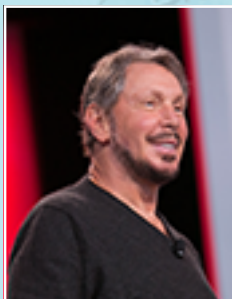
Lawrence J. Ellison Founder, Executive Chairman of the Board, and Chief Technology Officer