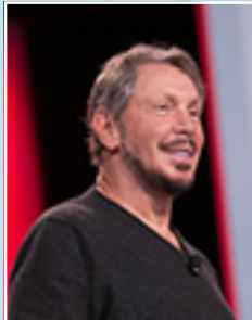
Lawrence J. Ellison Fundador, Presidente Execu- tivo do Conselho e Diretor de Tecnologia (CTO)