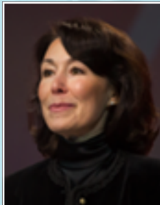
Safra Catz Diretora Executiva (CEO)